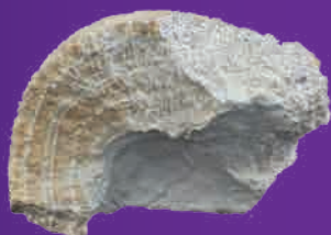
天然記念物 北投石